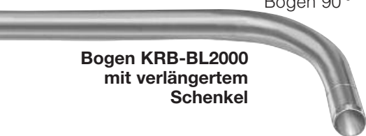
Bogen KRB-BL2000 mit verlängertem Schenkel