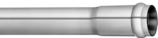
Typ KRSEM, mit Muffe