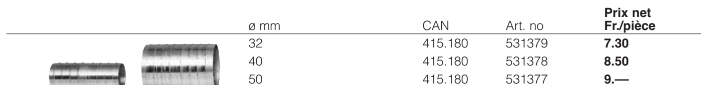
Manchons doubles intérieur