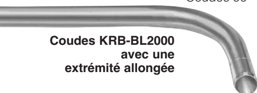
Coudes KRB-BL2000 avec une extrémité allongée